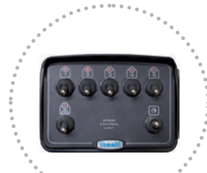
Comando elettrico di serie Electric panel included