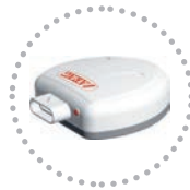
Sensore Velocita Gps GPS speed sensor