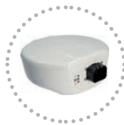
Ricevitore Gps Gps Receiver