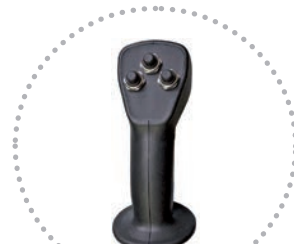
Joystick di serie Joystick included